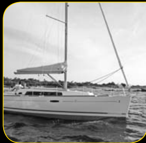
OCEANIS 34 A partire da 69 900€**