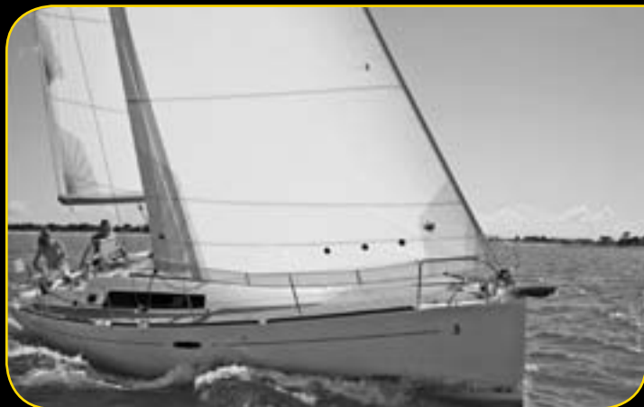
OCEANIS 37 A partire da 87 900€**