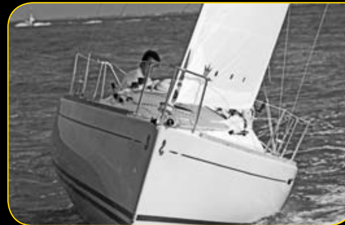
FIRST 21.7 Dynamic S A partire da 18 500€**

Imbattibile per il prezzo, il confort e la performance, lasciatevi conquistare dalla serie speciale DYNAMIC S : l'allestimento DYNAMIC e il kit vele vi sono offerti ! (1)