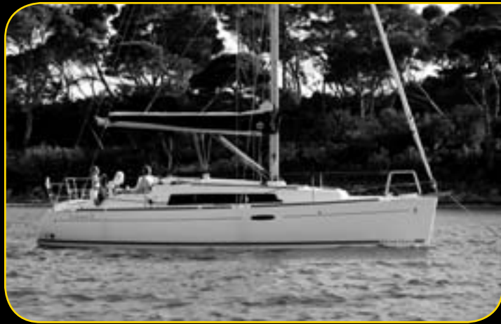
OCEANIS 31 A partire da 56 900€**

Approfittate dei prezzi eccezionali con vantaggi cliente fino a 14 351 € sui seguenti modelli :