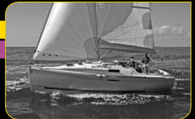
FIRST 27.7 Dynamic S A partire da 47 500€**